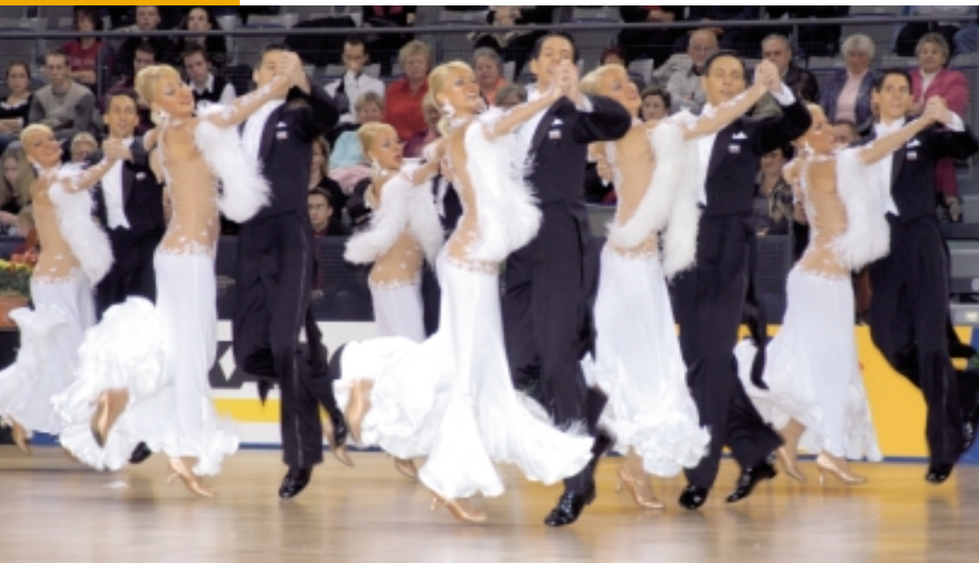
Foto oben: Der Traum vom Titel wird bald wahr: Dreamworld vom 1. TC Ludwigsburg.