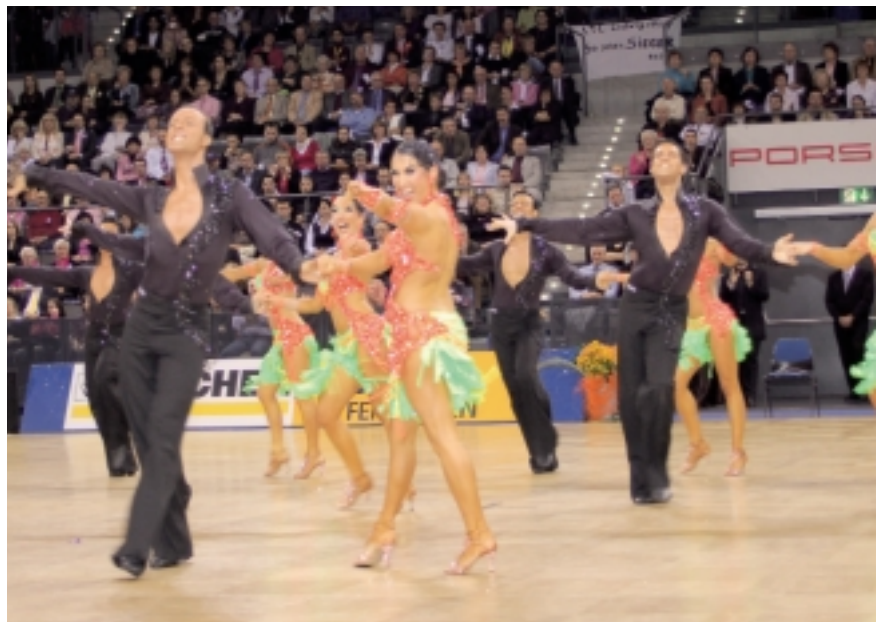
Foto oben links: Die neuen Meister und ihr "altes" Drums Project: TSG Bremerhaven.

D ie Lorbeeren, die in der neuen Stuttgarter Porsche Arena verteilt wurden, sind als Ruhekekissen denkbar ungeeignet, und die "roten Laternen" in der Abstiegszone nicht auf Dauerbetrieb eingestellt. Dennoch: die Rückeroberung des Meistertitels nach zehn Jahren Wartezeit ist für den 1. TC Ludwigsburg wie Weihnachten und Ostern zusammen, und die Festigung der nationalen Vormachtstellung für die TSG Bremerhaven die Bestätigung, dass sie "die" konstante Größe im Lateinformationsanz in Deutschland ist.