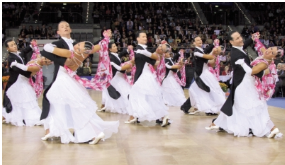
Foto rechts: Musica é, Eros Ramazzotti und keinen Titel mehr: Braunschweiger TSC.